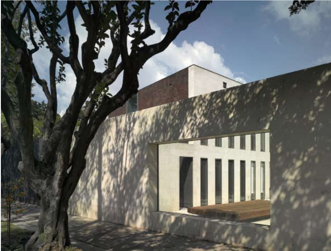
Deutsche Botschaft Mexiko, Kanzleigebäude, Mexiko- Stadt, 2002–2006