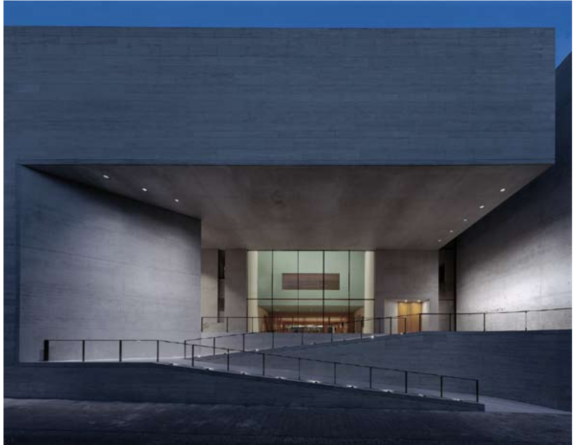
Museum Georg Schäfer, Schweinfurt, 1997–2000, Foto: Ivan Nemeč