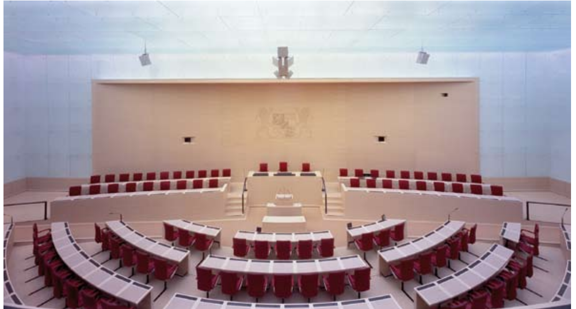
Maximilianeum München, Umgestaltung des Plenarsaals des Bayerischen Landtags, München 2000–2005, Foto: Werner Huthmacher

Volker Staab formuliert mit seinem Werk ein starkes Plädoyer für die Architektur als Kunst. Der zunehmenden Technisierung von Gebäuden stellt er eine präzise ästhetische Setzung entgegen, die in ihrer zweckgebundenen Schönheit meisterliche Proportionen und noble Eleganz verbindet. Souverän und doch mit größter Bescheidenheit gegenüber dem Bestehenden erreicht Volker Staab dabei Raumschöpfungen von greifbarer Atmosphäre und fesselnder Bildhaftigkeit.