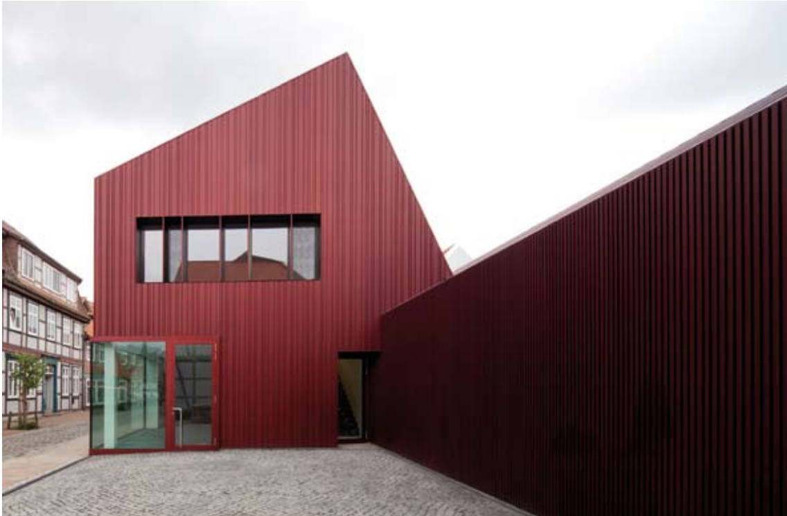
Erweiterung Nya Nordiska, Dannenberg, 2008–2010